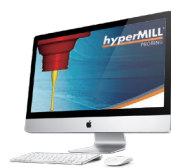
追い込み加工工程